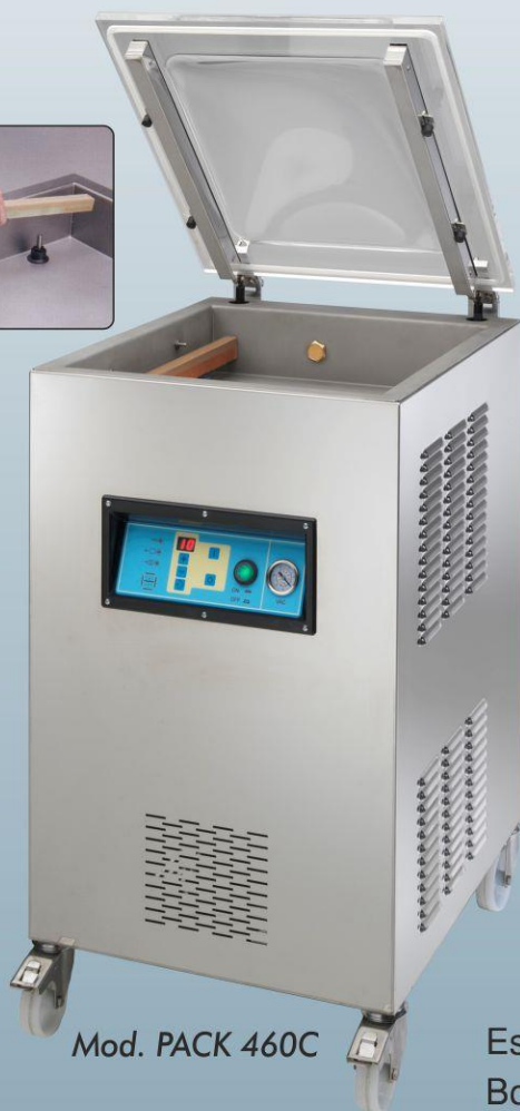
Mod. PACK 460C

Se trata de máquinas sumamente fiables, construidas cuidadosamente y con la máxima atención en aquellos detalles que marcan la diferencia de calidad. Responden a las exigencias de los pequeños y medianos productores. Máquinas profesionales de campana para instalaciones de medias dimensiones. Para envasar al vacío una gran variedad de alimentos y otros productos que se deterioran en contacto con el aire, para prolongar su tiempo de conservación.