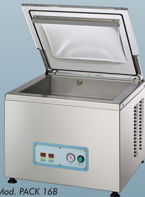
Mod. PACK 16B

No existen contactos con cables volantes. Las barras pueden extraerse fácilmente para efectuar la limpieza